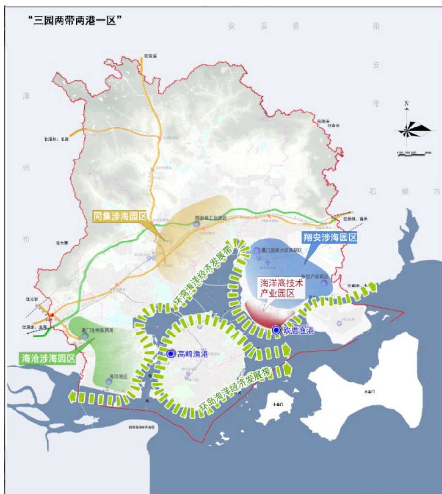
图 2 厦门市海洋经济空间总体布局（2021-2025 年）