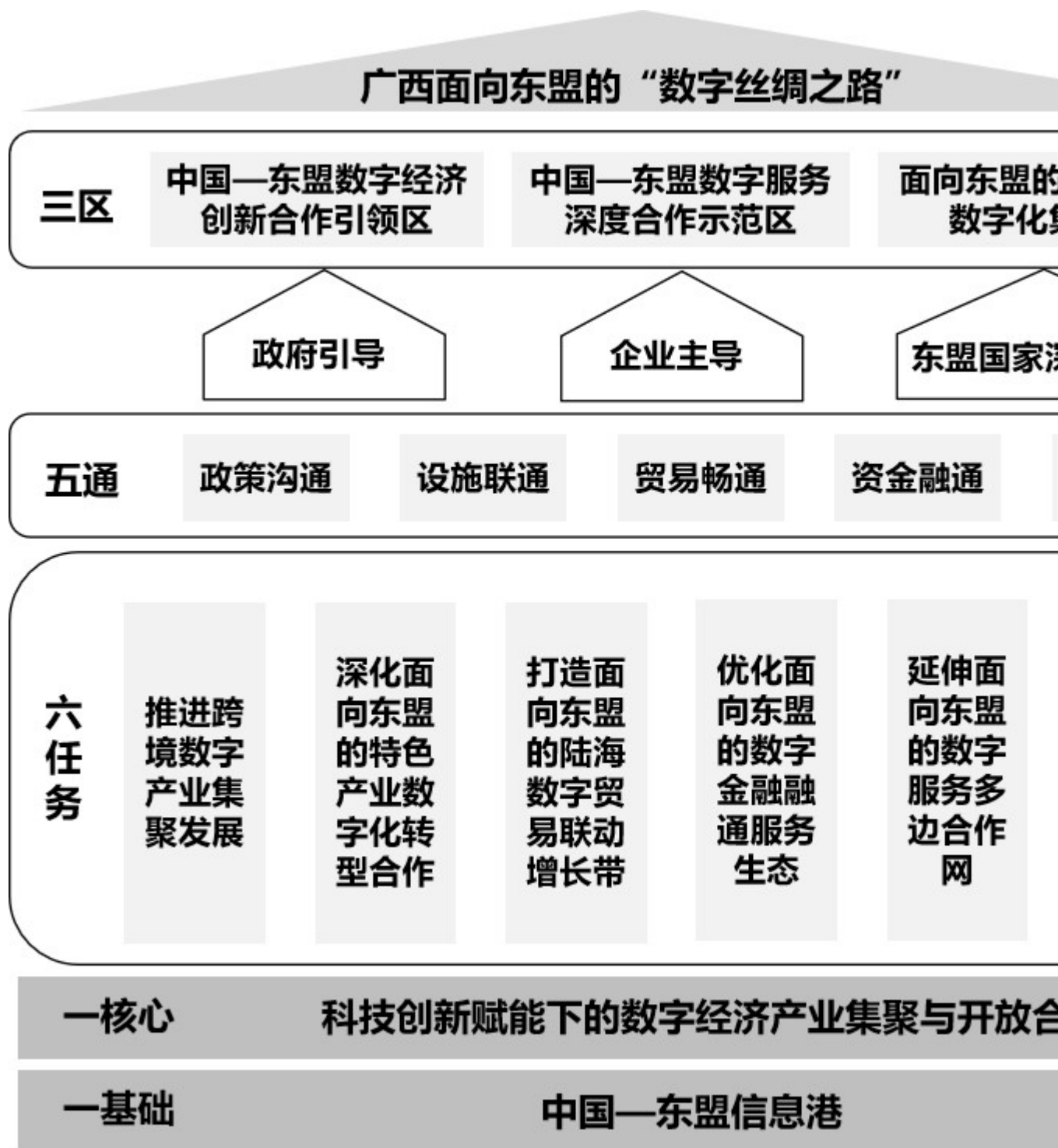
图 1 广西面向东盟的“数字丝绸之路”总体框架示意图